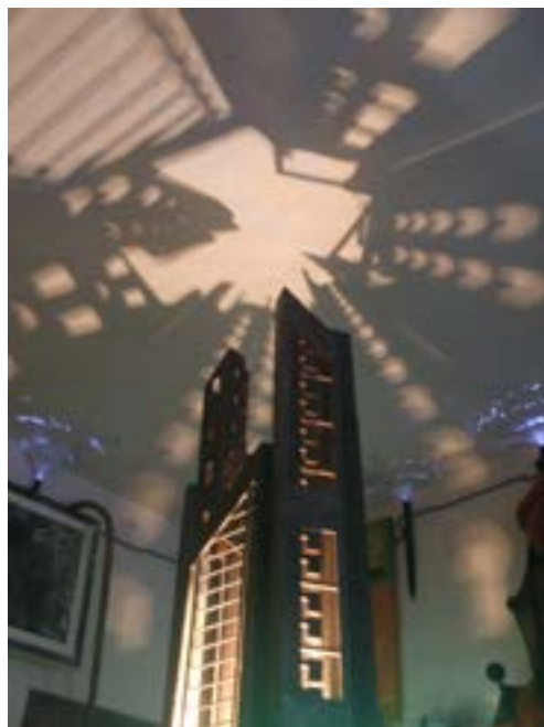
▲ ci-dessus : Erolf Totort - dessins et gravures ci-contre et ci-dessous : Robuste Odin - lampes et sculptures ▶